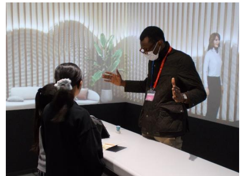
〈TGG での体験活動の様子〉

今年度は、少しずつ体験活動や外部講師を迎えた学習も行うことができました。1月は、6年生が「子供を笑顔にするプロジェクト」で、「TGG (TOKYO GLOBAL GATEWAY)」に校外学習で行きました。「TGG」は立川市のGREEN SPRINGSに1月16日にオープンした体験型英語学習施設です。ネイティブな講師と『エアポート』『ホテル』などの場の設定の中で、「このお土産がほしいのですが。」など会話体験や、多文化交流やコマ取り作品づくりなど、作業や活動を通して、授業で学んでいる英語を使って、初めて出会った人とコミュニケーションを取ろうとすること、その楽しさを感じたようでした。2020年から小学校で実施された外国語ですが、コミュニケーションを取ることの楽しさを味わわせ意欲につなげていきたいと思えます。