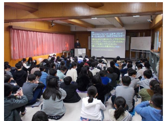
〈情報モラル教室の様子〉

ゲームやスマートフォン等の使い方について、ご家庭で、お子さんとルールについて話し合ってください、見守っていただければ幸いです。あと、2か月で今年度が修了となります。新学年へ向け、各学年のまとめを行っていききたいと思います。