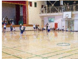
2年生 きらりんピック ～Rokusho 2020～