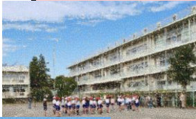
4年生 みんなのミニ運動会