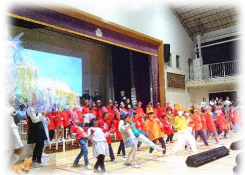
海の世界に連れて行ってくれた2年生。