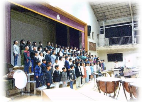
5年生、きれいな音楽を奏でました。

11月17日(金)18日(土)に、学習発表会が行われました。この日のために練習を重ね、全ての学年が成果を発揮しました。保護者の皆様におかれましては、御鑑賞・アンケートに御協力いただき、ありがとうございました。