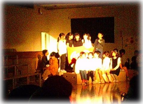
東久留米について教えてくれた3年生。