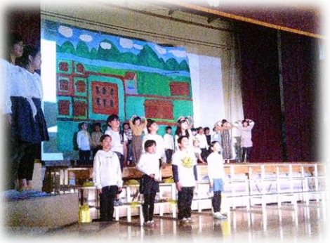
歌と劇でごんぎつねを表現した、4年生。