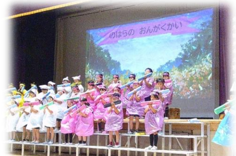
1年生、かわいい音楽会でした。