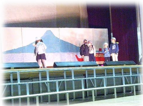
宿泊学習楽しかったね、すすかけ学級。