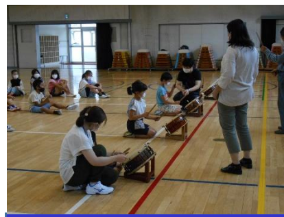
竹の子まつり お囃子