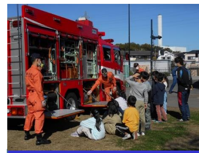
消防自動車写生会