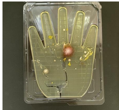
石けんで洗った後、 髪の毛をさわった手