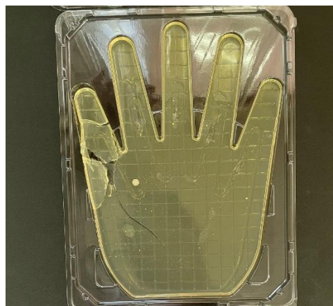
石けんで1分間洗った手