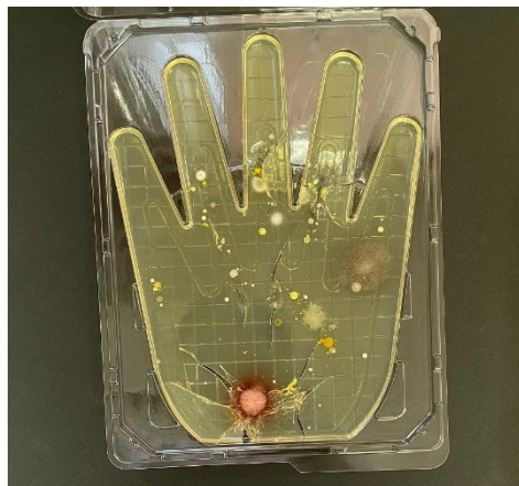
石けんで洗った後、 服で拭いた手