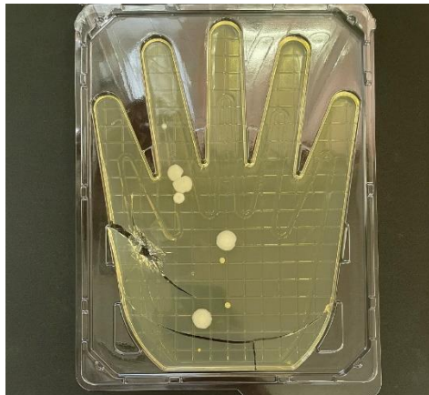
アルコール消毒のみ