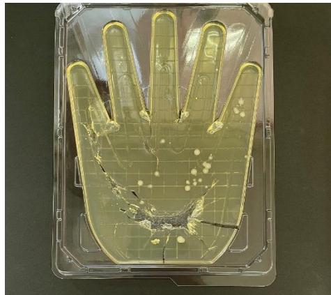
水だけで1分間洗った手